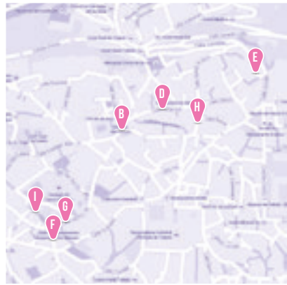
Q Casco Antiguo