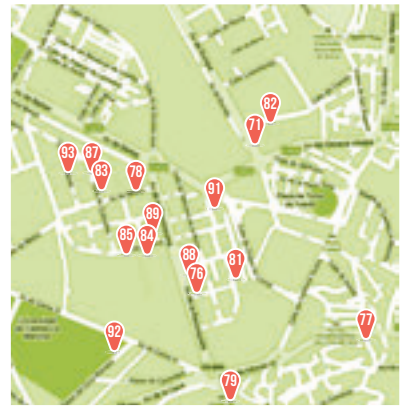
Q Sta. Teresa y Varios